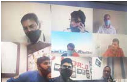
Business review with Bulk heads, Regional heads, OC and Business head of Bulk